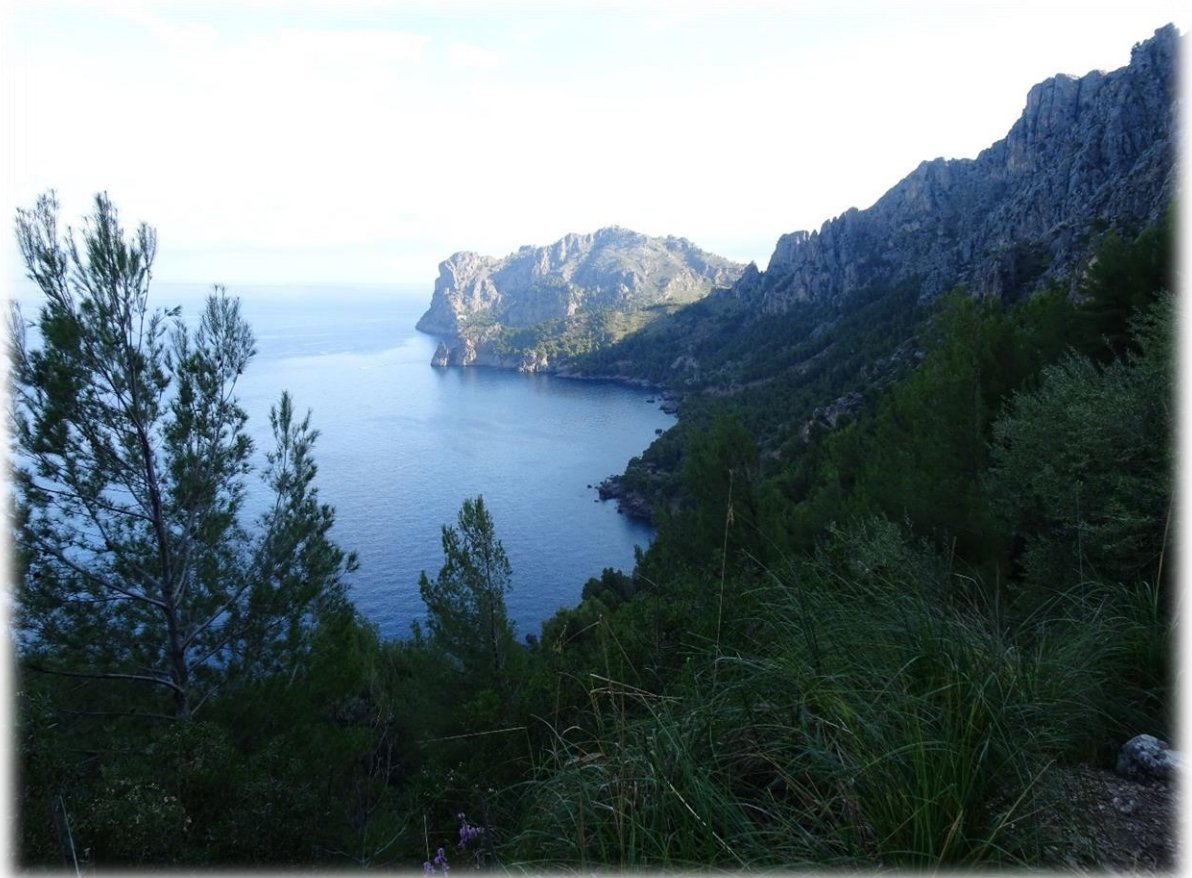
De steeneik is een boom uit de napjesdragersfamilie. Deze van nature in Zuid-Europa voorkomende, groenblijvende eik wordt veel aangeplant als sierboom en ter beschutting,