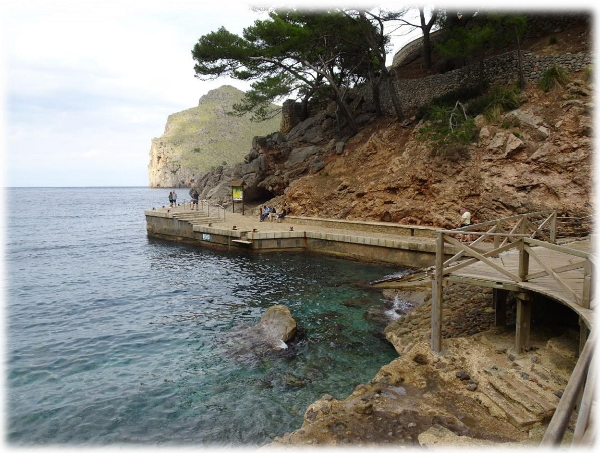
Sa Calobra heeft een prachtige baai, geweldige rotspartijen en helder blauw water. De stranden liggen in verschillende kloven, daarmee onderscheidt het zich van de andere stranden van Mallorca.