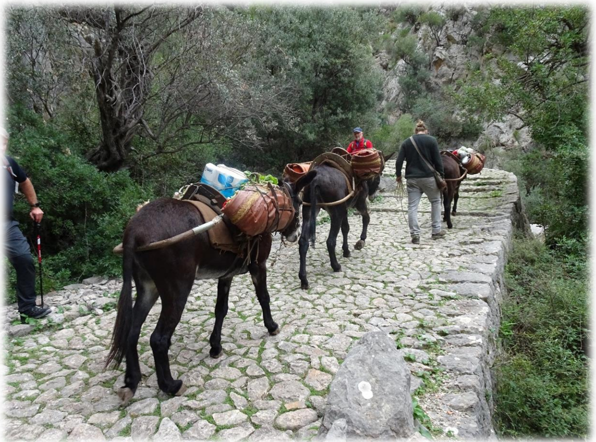
Een plaatselijke bergbewoner heeft boodschappen gedaan in het nabijgelegen dorp. Om zijn waren te vervoeren maakt hij gebruik van ezels. De man heeft onder andere twee bidons gas