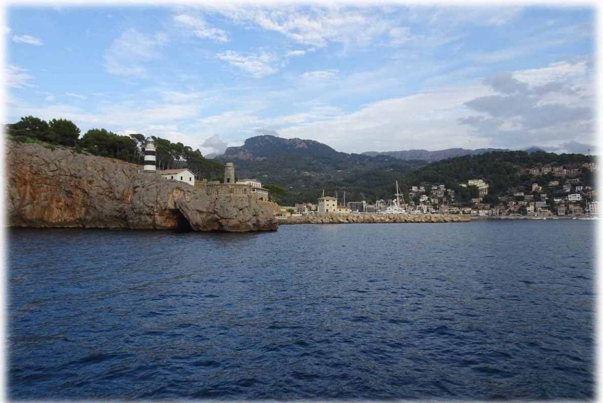
Het gesteente in Mallorca bestaat vooral uit stuwingsgesteente maar deels ook uit lava van vroegere erupties.