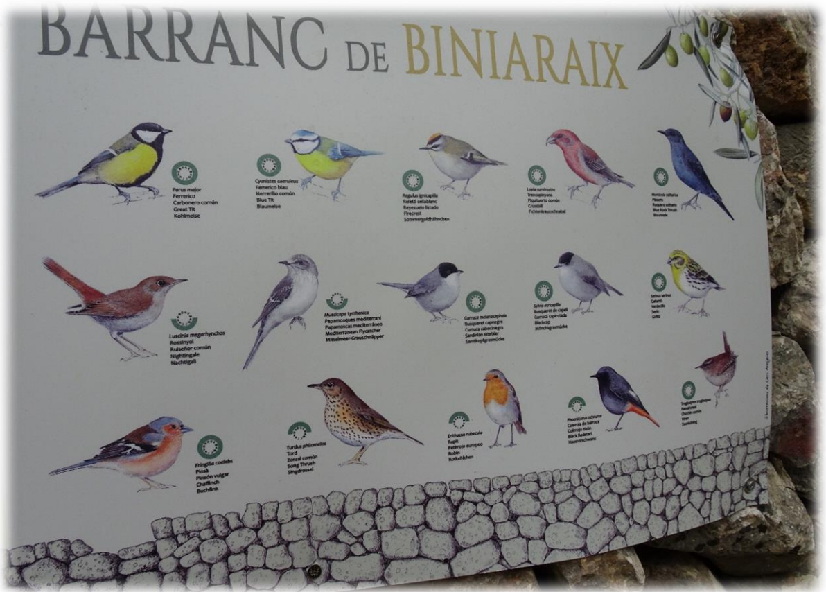
Een bord onderweg laat ons zien welke vogels men in dit gebied kan aantreffen.