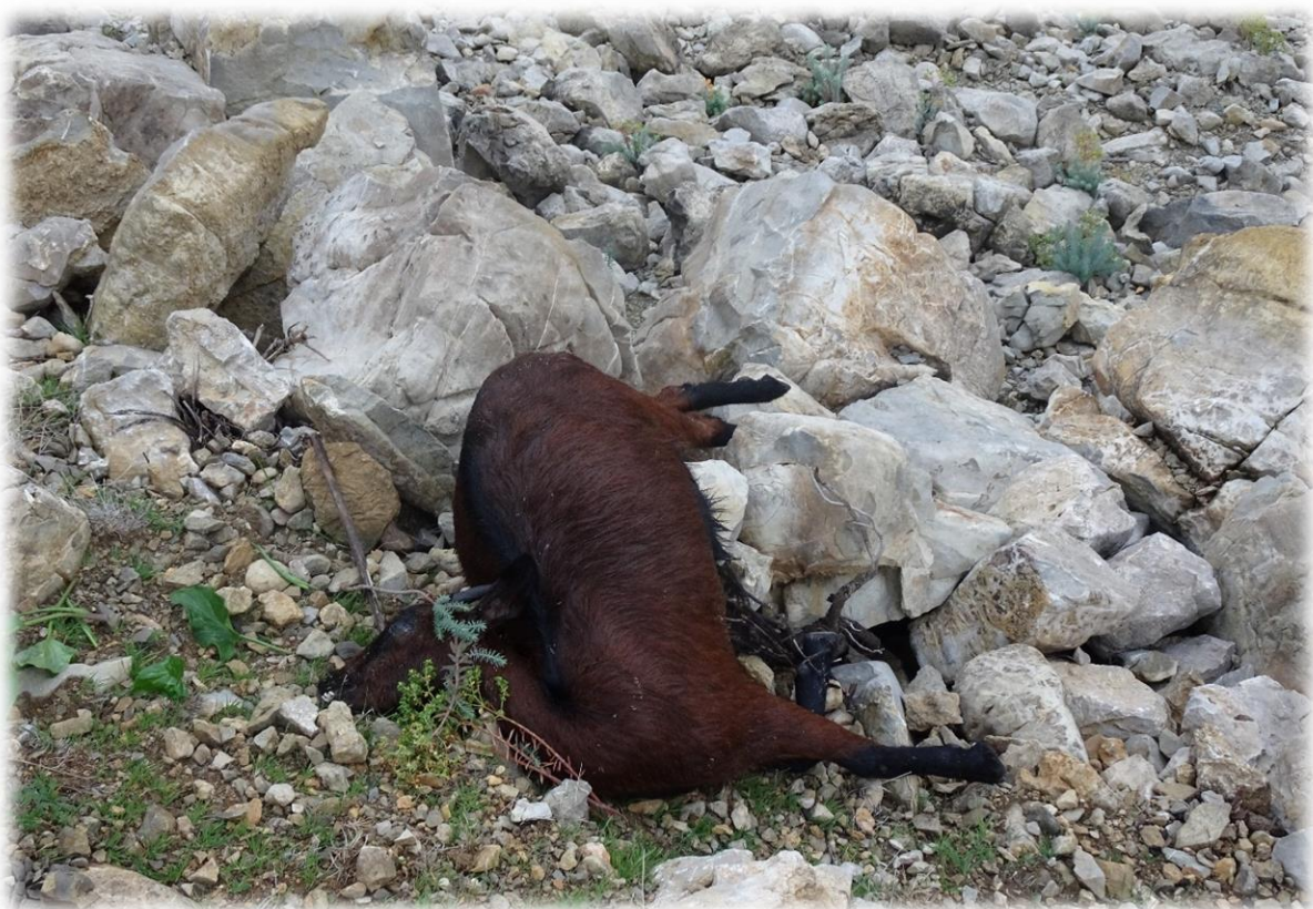
Een dode geit. Een natuurlijke dood gestorven of van de berg gevallen?