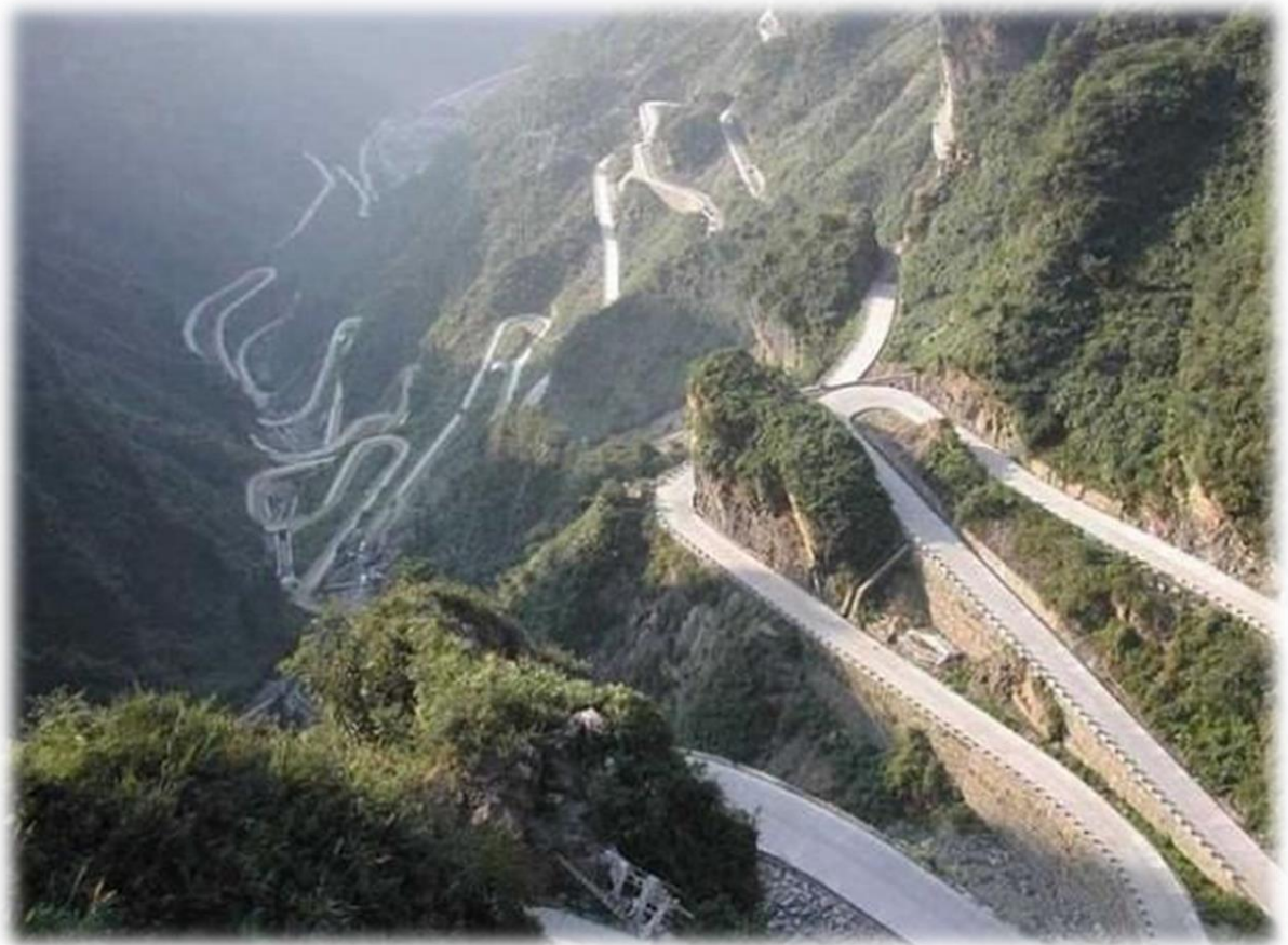
De Cala de sa Calobra (Slangenbaai) dankt haar naam aan de als een slang in haarspeldbochten naar de zee omlaag kronkelende weg.