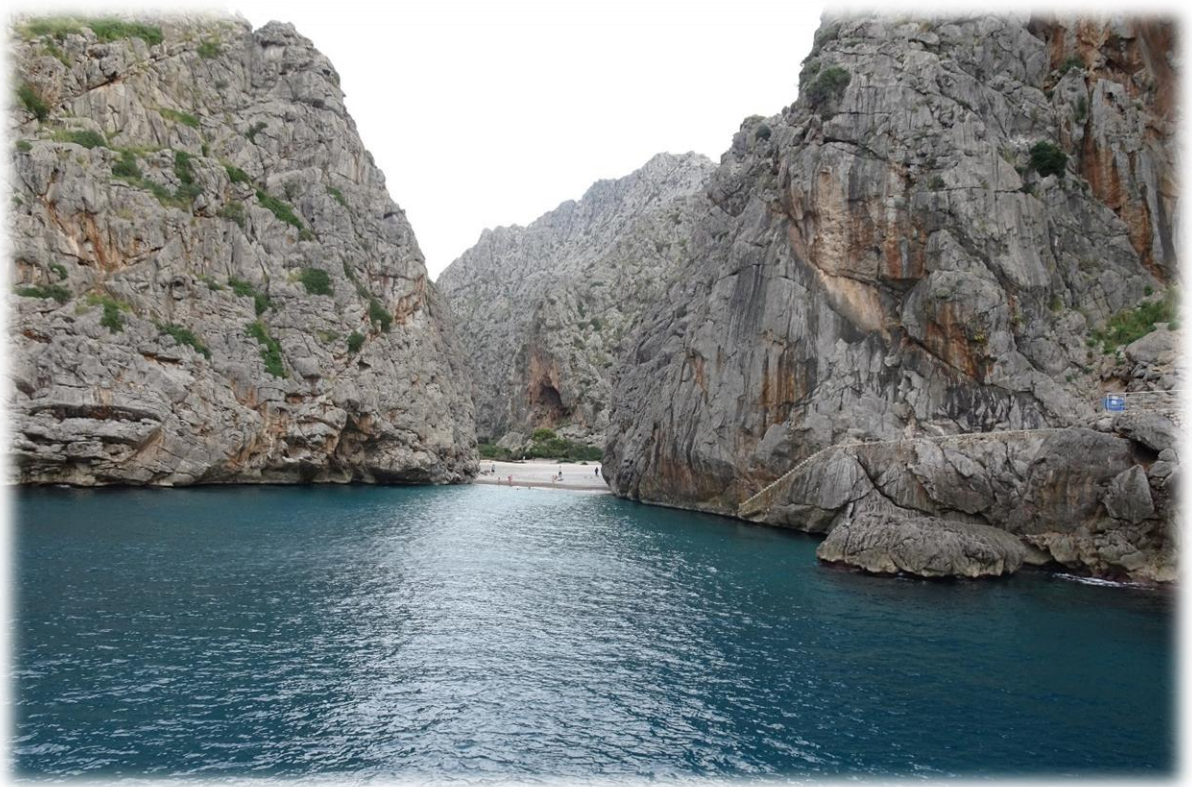
We keren terug naar Port de Sollèr met de boot. Onderweg zien we verschillende strandjes en prachtige rotspartijen.