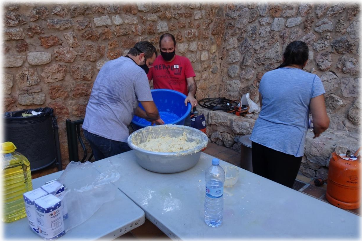
Op het dorpsplein zijn enkele mensen bezig met het maken van deeg. We weten echter niet wat het eindresultaat zal worden.