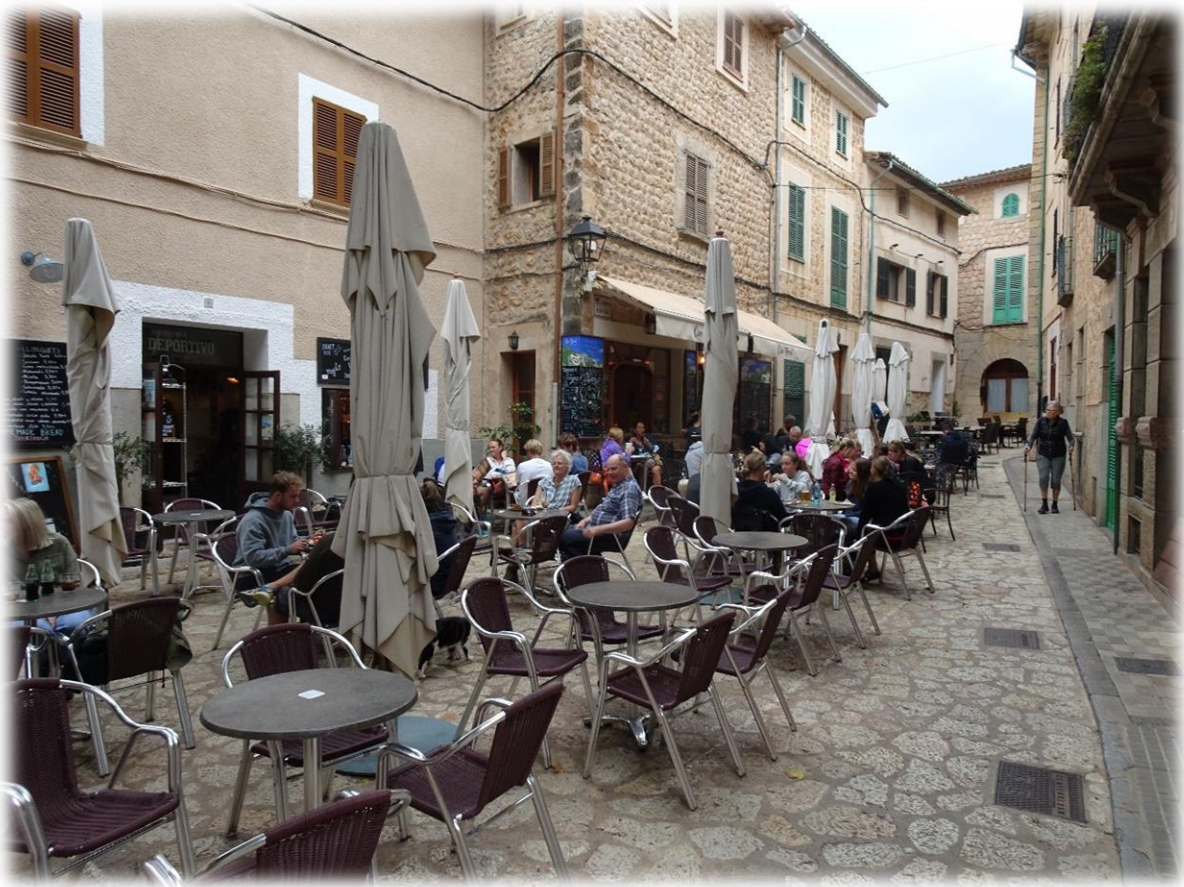
Het authentieke bergdorp Fornalutx ligt hoog in het Tramuntana-gebergte met uitzicht op Sollèr. Vaak aangeduid als het 'mooiste dorp van Spanje', combineren de stenen gebouwen en