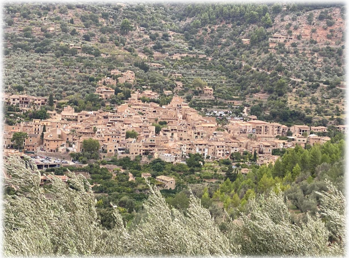
Reeds van ver zien we het bergdorpje Fornalutx liggen.